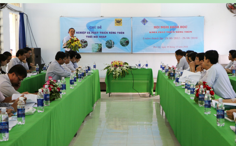
Toàn cảnh Hội nghị khoa học Nông nghiệp và Phát triển nông thôn thời hội nhập tại Khoa Phát triển Nông thôn.

Ngày 30/12/2016, Khoa Phát triển Nông thôn, Trường Đại học Cần Thơ tổ chức Hội thảo khoa học với chủ đề Nông nghiệp và Phát triển nông thôn thời hội nhập nhằm tổng kết các nghiên cứu liên quan đến nông nghiệp và phát triển nông thôn, trao đổi kinh nghiệm trong nghiên cứu và ứng dụng khoa học kỹ thuật trong nông nghiệp và phát triển nông thôn, giao lưu, tạo cầu nối giữa các nhà nghiên cứu ở các viện, trường, trung tâm nghiên cứu với cán bộ khoa học kỹ thuật, cán bộ khuyến nông và nông dân vùng Đồng bằng sông Cửu Long (ĐBSCL), đồng thời kỷ niệm 05 năm ngày thành lập Khoa Phát triển Nông thôn (28/6/2011-28/6/2016).