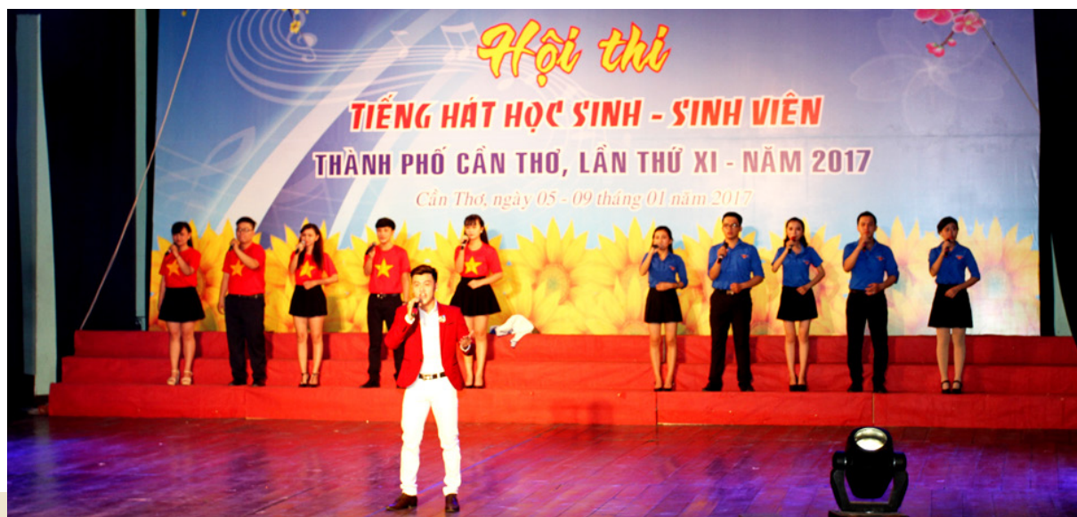
Tiết mục Đơn ca Nam “Tổ quốc gọi tên mình”.

“Dậy mà đi”; tiết mục múa “Ký ức của Mẹ”; tiết mục đơn ca nam “Tổ quốc gọi tên mình”, tiết mục ca múa “Giai điệu tự hào”; 01 giải Nhì (tiết mục song ca “Gặp nhau giữa rừng mơ”) và 01 giải Ba (tiết mục tốp ca “Hành khúc thanh niên tình nguyện Đại học Cần Thơ”). Với kết quả này, Đội Văn nghệ Trường Đại học Cần Thơ đã được xếp hạng Nhất toàn đoàn.