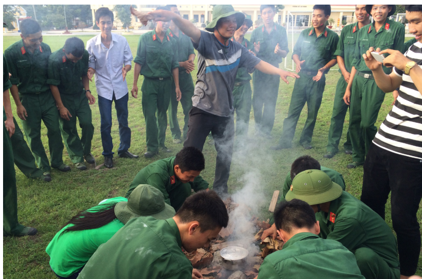
Tham gia trò chơi lớn.

ĐHCT đã tổ chức chuyến thăm và chương trình giao lưu với cán bộ, chiến sĩ Trung đoàn Bộ binh 1, Sư đoàn Bộ binh 330.