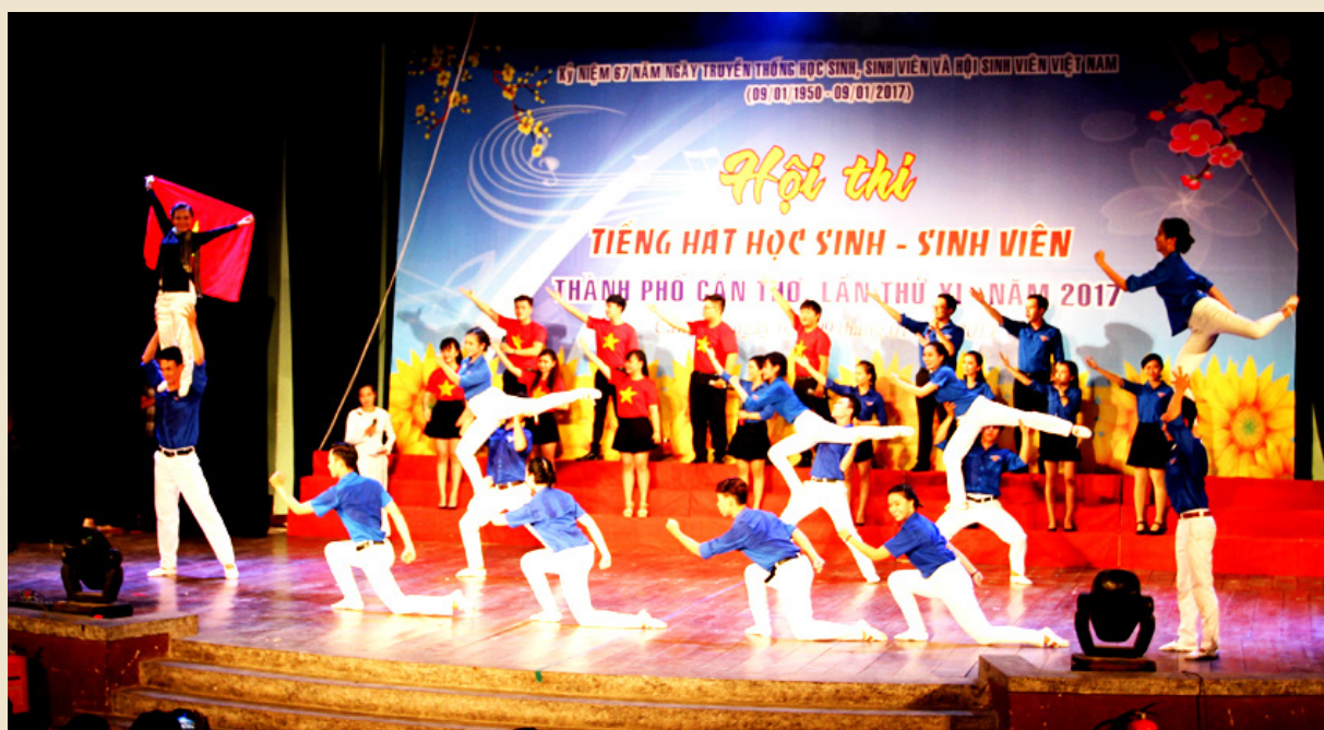
Tiết mục Tốp ca “Hành khúc thanh niên tình nguyện Đại học Cần Thơ”.

Từ ngày 05/01 đến 09/01/2017, tại Nhà Biểu diễn-Trung tâm Văn hóa thành phố Cần Thơ, Ban Thường vụ Thành Đoàn Cần Thơ phối hợp cùng Sở Giáo dục và Đào tạo thành phố Cần Thơ tổ chức “Hội thi Tiếng hát học sinh, sinh viên thành phố Cần Thơ lần thứ XI-năm 2017”. Hội thi năm nay được tổ chức có chủ đề là “Học sinh, sinh viên Cần Thơ tiến bước dưới cờ Đoàn” với gần 700 diễn viên là học sinh, sinh viên của 18 đơn vị dự thi gồm 09 trường đại học, cao đẳng và khối các trường trung học phổ thông của 09 đơn vị quận, huyện đoàn trực thuộc.