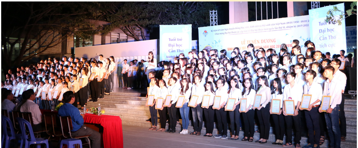
Tổng số 522 sinh viên được công nhận danh hiệu sinh viên 5 tốt cấp trường năm học 2015-2016.

Đoàn Thanh niên, Hội Sinh viên Trường ĐHCT cùng với Thành đoàn thành phố Cần Thơ đã tạo điều kiện cho sinh viên của Trường phấn đấu, rèn luyện để đạt danh hiệu này. Bên cạnh đó, đối với Trường ĐHCT, ngoài vấn đề về chất lượng đào tạo, "Hội nhập" là một trong những tiêu chí mà Nhà trường hướng đến. Chính vì vậy, trong thời gian qua, Nhà trường đã điều chỉnh các chương trình đào tạo để sinh viên không chỉ học tập về chuyên môn mà còn chú trọng phát triển thể chất, ngoại ngữ và kỹ năng mềm. Trong năm 2016, Trường đã dành một phần học bổng cho sinh viên đi giao lưu quốc tế và hoạt động này sẽ được duy trì trong những năm tiếp theo. Nhà trường mong rằng các em sẽ nỗ lực, phấn đấu rèn luyện nhiều hơn nữa giành lấy cơ hội học tập và giao lưu ở nước ngoài, để xây dựng và quảng bá hình ảnh Trường ĐHCT ngày càng đẹp hơn trong mắt bạn bè quốc tế.