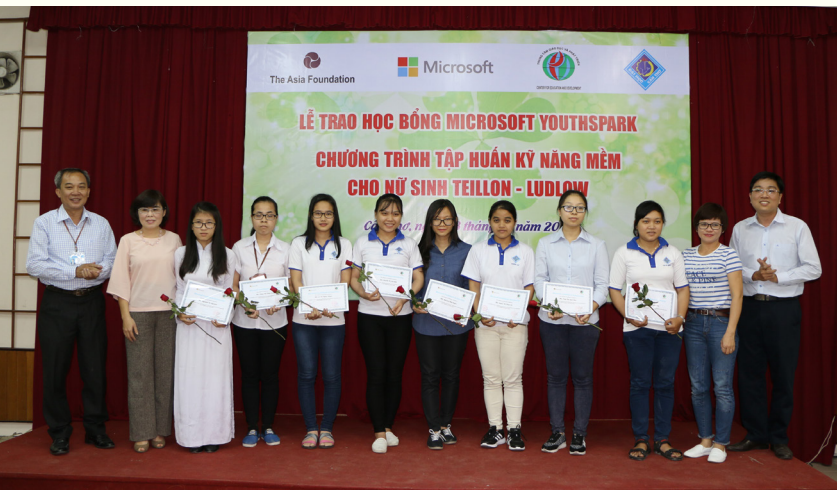
Trao học bổng Microsoft Youthspark cho 08 nữ sinh ngành Khoa học máy tính và Công nghệ thông tin, Trường ĐHTC.

Chương trình Microsoft YouthSpark nhằm thu hút nữ giới tham gia vào nền kinh tế số và giúp họ nâng cao nhận thức về những lợi ích trong công nghệ thông tin, một lĩnh vực phát triển nhanh và đầy hứa hẹn. Nữ sinh có tài năng và có niềm đam mê, cam kết theo đuổi nghề nghiệp trong lĩnh vực công nghệ thông tin sẽ được hỗ trợ tài chính, cung cấp các cơ hội phát triển nghề nghiệp.