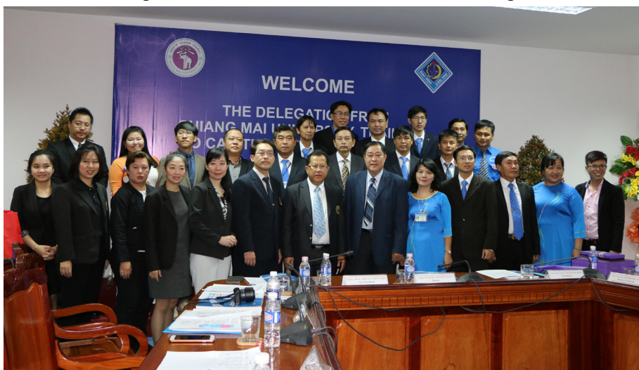
Ảnh lưu niệm.

Với mục tiêu xúc tiến các hoạt động hợp tác giữa hai trường trên cơ sở bản ghi nhớ được ký