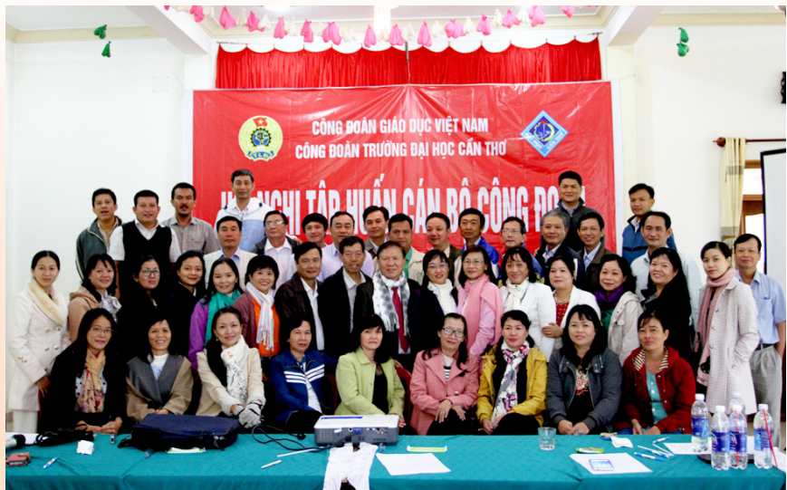
Ảnh lưu niệm tại Hội nghị.