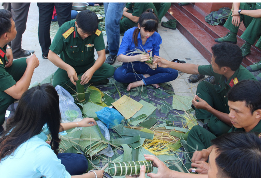
Hội thi "Gói bánh tét ngày xuân" (Nguồn: Thành đoàn Cần Thơ).

nghĩa, thiết thực đã diễn ra như: nấu ăn với chủ đề " Mâm cơm ngày xuân ", Hội thi " Gói bánh tét ngày xuân ", giao lưu văn hóa văn nghệ và tổ chức trò chơi lớn.