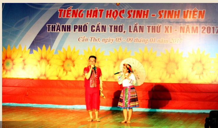
Tiết mục Song ca “Gặp nhau giữa rừng mơ”.

“Dậy mà đi”; tiết mục múa “Ký ức của Mẹ”; tiết mục đơn ca nam “Tổ quốc gọi tên mình”, tiết mục ca múa “Giai điệu tự hào”; 01 giải Nhì (tiết mục song ca “Gặp nhau giữa rừng mơ”) và 01 giải Ba (tiết mục tốp ca “Hành khúc thanh niên tình nguyện Đại học Cần Thơ”). Với kết quả này, Đội Văn nghệ Trường Đại học Cần Thơ đã được xếp hạng Nhất toàn đoàn.