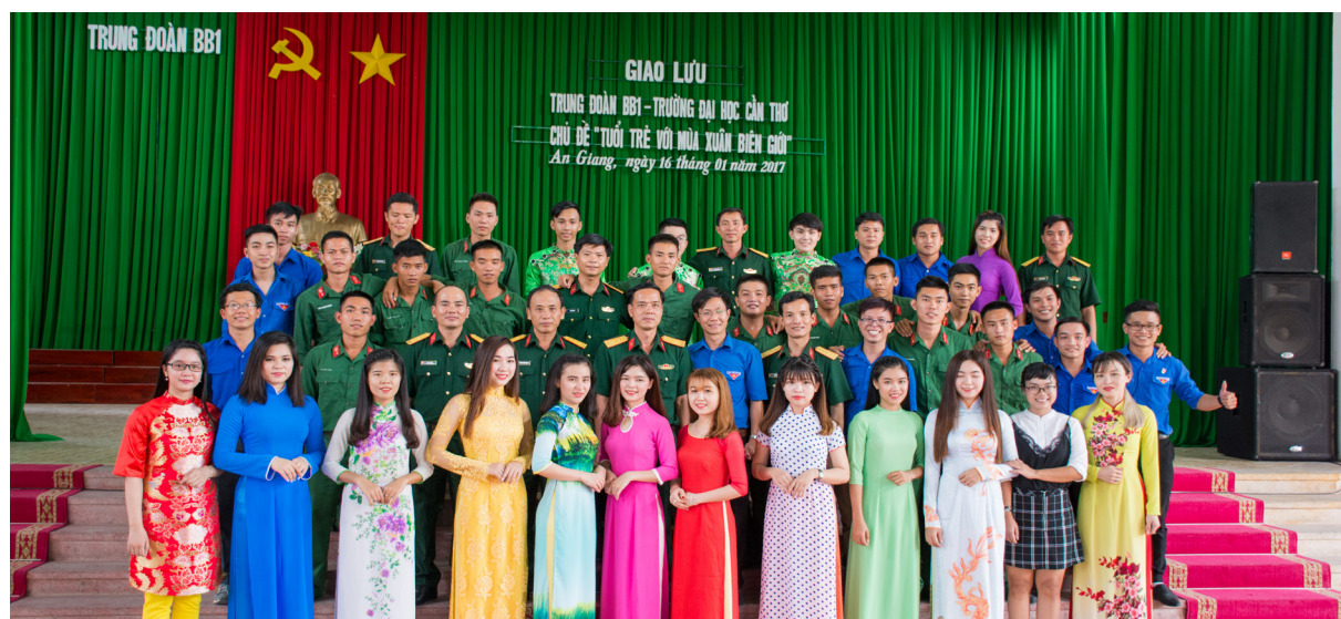
Ảnh lưu niệm tại buổi giao lưu với Trung Đoàn Bộ binh 1.

Trong không khí vui tươi, ấm áp của chương trình giao lưu văn nghệ, tuổi trẻ Khoa Phát triển Nông thôn-Trường Đại học Cần Thơ và các chiến sĩ Trung đoàn 1 đã mang đến những tiết mục mộc mạc nhưng mang nhiều ý nghĩa góp thêm niềm vui cho các chiến sĩ trong những ngày cận kề năm mới.